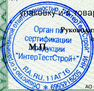
схема сертификации 4с, Знак соответствия наносится на упаковку и в товаросопроводительной документации. Форма и размеры знака по ГОСТ Р 50460-92

Руководитель (заместитель руководителя) органа по сертификации